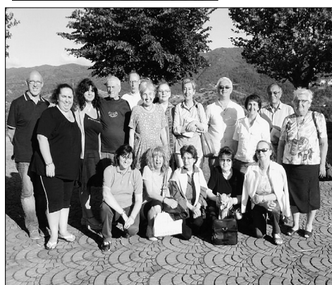
22 giugno 2013: nella casa di Santa Maria Mazzerello a Valponasca un ridotto gruppo di cursillisti si riunisce per un pomeriggio di silenzio, di preghiera e di adorazione continua, è un'esperienza davvero bella da ripetere al più presto.