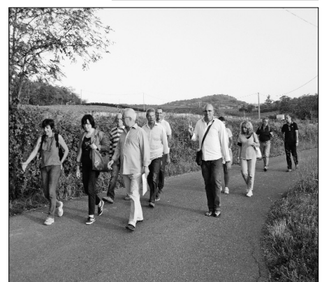
21 settembre 2013: sulle colline di Codevilla e Mondondone il Cursillo si ritrova per meditare sulle ambiguità del cammino (pomeriggio in una campagna splendida) e per conferire il mandato a chi avrebbe annunciato il Cursillo.