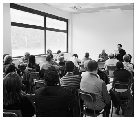
10 marzo 2013: nel centro pastorale Maria Regina di Serravalle Scrivia si tiene un incontro per discutere insieme su come proporre il Cursillo in un mondo sempre più scristianizzato e con gravi difficoltà socio-economiche.